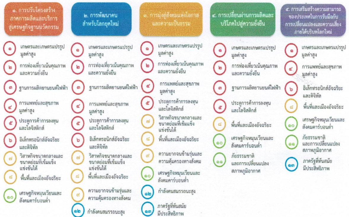
แผนภาพที่ ๓.๑ ความเชื่อมโยงระหว่างหมุดหมายการพัฒนากับเป้าหมายหลัก

ความเชื่อมโยงระหว่างหมุดหมายการพัฒนากับเป้าหมายหลักแสดงไว้ในแผนภาพที่ ๓.๑ โดยหมุดหมายการพัฒนากำหนดขึ้นเป็นประเด็นที่มีลักษณะเชิงบูรณาการที่ครอบคลุมการพัฒนาตั้งแต่ในระดับต้นน้ำจนถึงปลายน้ำ และสามารถนำไปสู่ผลพัฒนาทั้งในมิติเศรษฐกิจ สังคม ทรัพยากรธรรมชาติและสิ่งแวดล้อมไปพร้อมๆ กัน ทำให้หมุดหมายแต่ละประการสามารถสนับสนุนเป้าหมายหลักได้มากกว่าหนึ่งข้อ นอกจากนี้การพัฒนาภายใต้แต่ละหมุดหมายไม่ได้แยกขาดจากกัน แต่มีการสนับสนุนหรือเอื้อประโยชน์ซึ่งกันและกัน